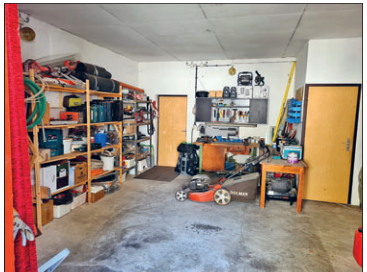
Umzug Werkstatt in ehemalige Feuerwehr