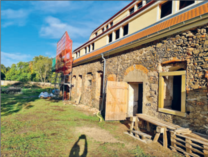
Beginn Einbau neuer Fenster- und Türgewände Haus 1