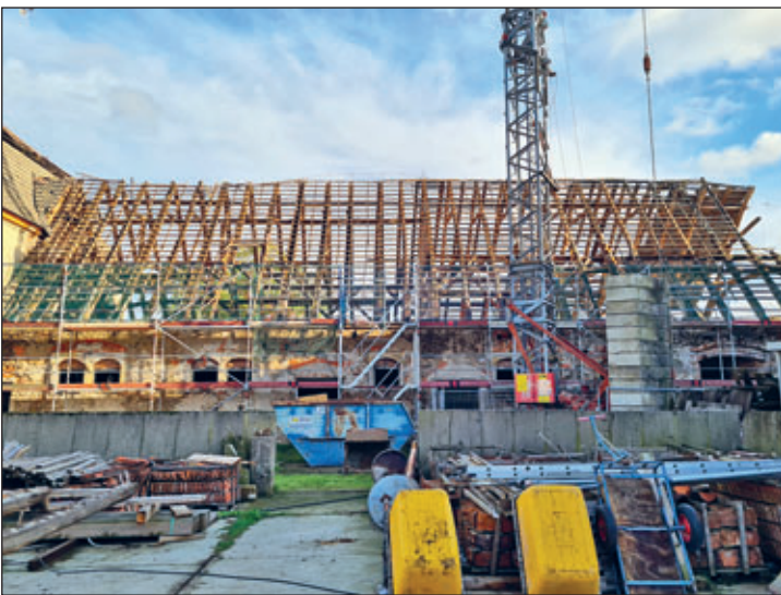
Rückbau alter Dachstuhl - Haus 3