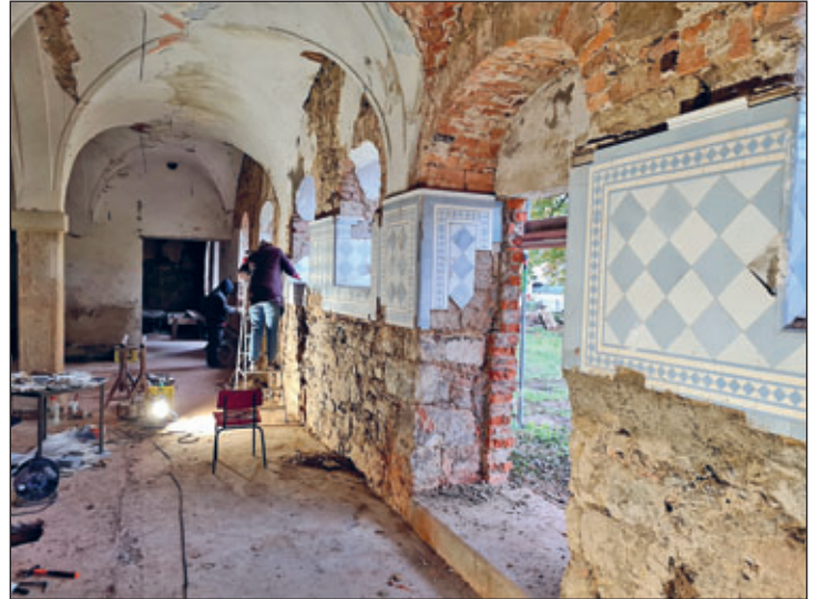
Sanierung Fliesenspiegel im ehemaligen Pferdestall