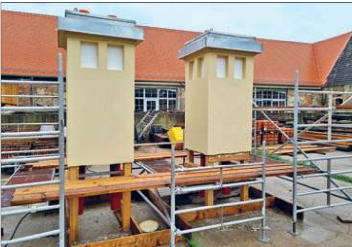
Schornsteinattrappen für Haus 1