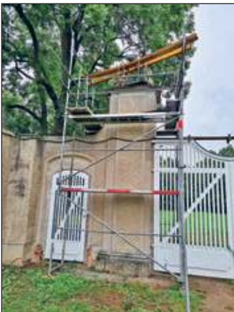
Sanierung Sandsteinabdeckung am Pfeiler Rosengarten