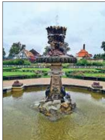
Springbrunnen im Rosengarten

Das Rosengarten-Cafe ist im September weiterhin sonntags von 14 bis 17 Uhr für Sie geöffnet.