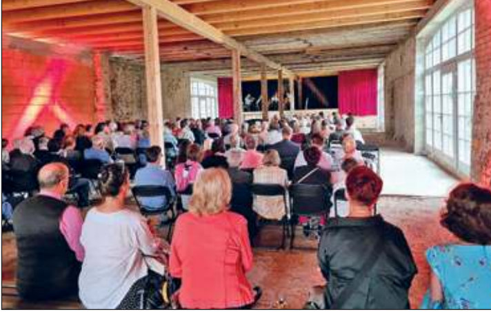
Kammernmusik in der Kulturscheune – Freies Ensemble Dresden

Im August schritten vor allem die Dachdeckerarbeiten am Haus 1 weiter voran. Außerdem wurden dort die beiden Schornsteinattrappen montiert. Im vergangenen Monat weihten wir ebenfalls mit mehreren Veranstaltungen unsere Kulturscheune ein.