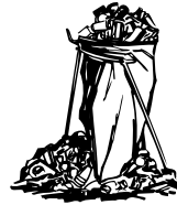
Heidehäuser Weg - Babywindeln

In letzter Zeit häufen sich wieder Müllablagerungen in unserem Gemeindegebiet. Die Beseitigung durch den Bauhof geht zu Lasten der Gemeinde und damit auf unser aller Kosten.