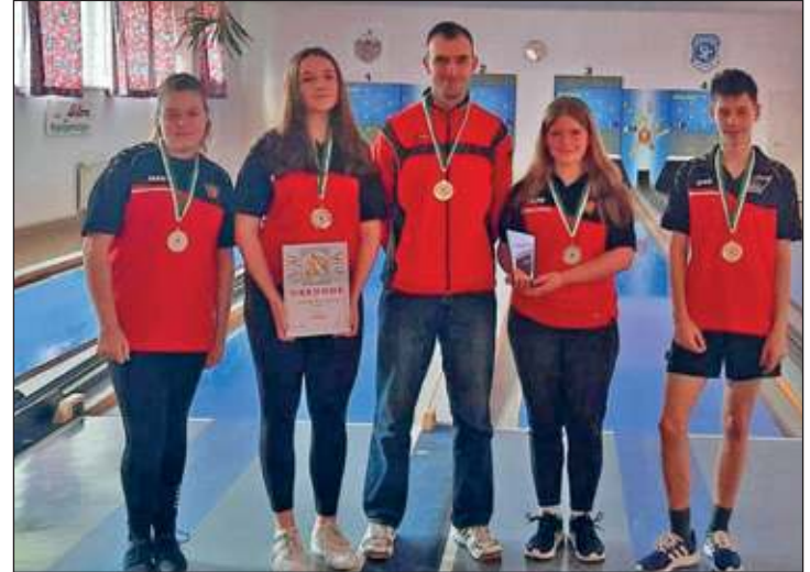
Die Jugendmannschaft des ESV Lok Wülknitz ist Kreismeister

Die Jugend des ESV konnte in dieser Saison alle 8 Spiele für sich entscheiden und ist somit verdient Mannschaftsmeister mit 7 Punkten