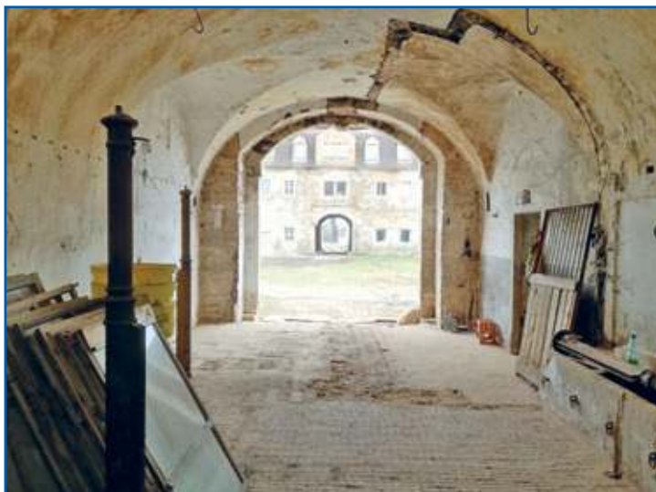
Blick durch geöffneten Torbogen des hinteren Torhauses