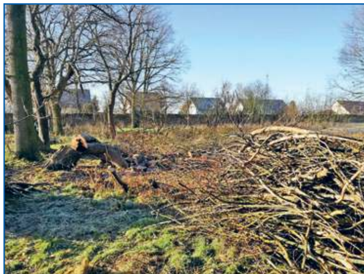
Entfernung Wildwuchs Schlossgraben - Bereich alte LPG-Häuser