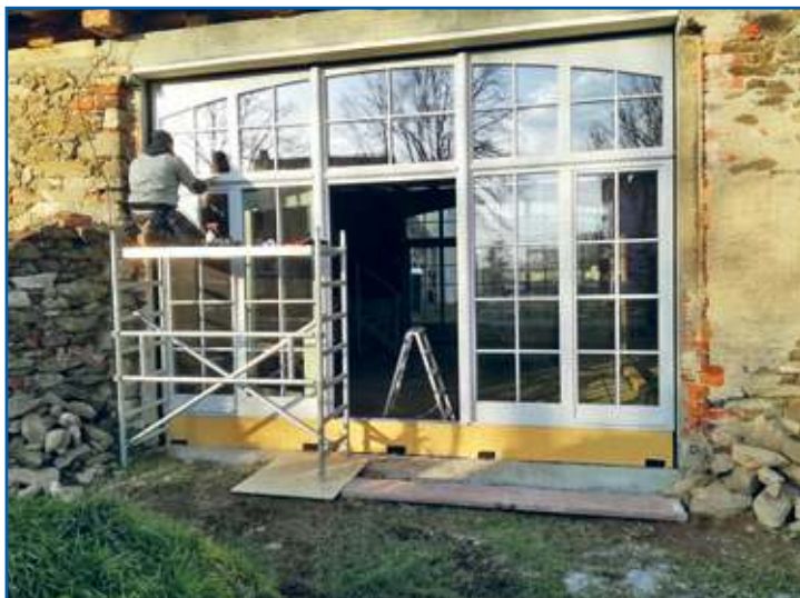
Scheune Einbau Glastore