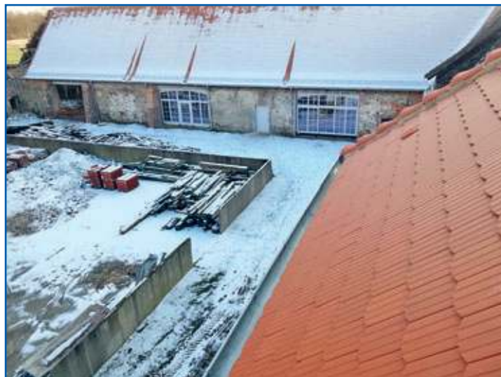
Scheune Einbau Glastore