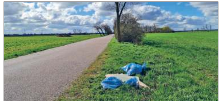
Bettelweg - Trockenbaureste und Elektromaterial