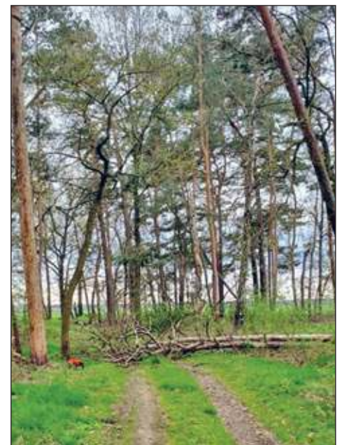
Pflegerückstände in den Wäldern führen zu einer erhöhten Brandlast und erschweren die Brandbekämpfung