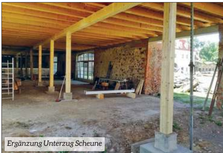
Ergänzung Unterzug Scheune

Auch im Monat Mai gingen an den verschiedenen Arbeitsplätzen auf unserem Gelände die Arbeiten weiter voran. Hier einige Beispiele auf den Bildern des Monats: