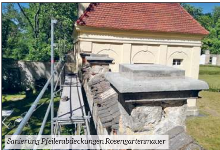
Sanierung Pfeilerabdeckungen Rosengartenmauer