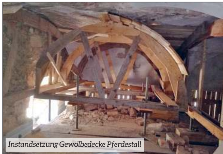
Instandsetzung Gewölbedecke Pferdestall