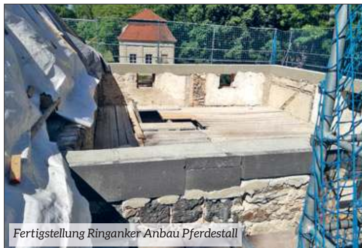
Fertigstellung Ringanker Anbau Pferdestall

Natürlich öffnet im Monat Juni wieder sonntags von 14:00 bis 17:00 Uhr unser Rosengarten-Cafe für Sie. Außerdem finden im Juni mit dem Musikpicknick am 18.06. und dem Rosenfest am 25.06. zwei weitere Veranstaltungen im Rosengarten statt. Bitte beachten Sie dazu unsere Hinweise im Mitteilungsblatt und auf dem Aufsteller am Kirchenparkplatz. Vielen Dank!