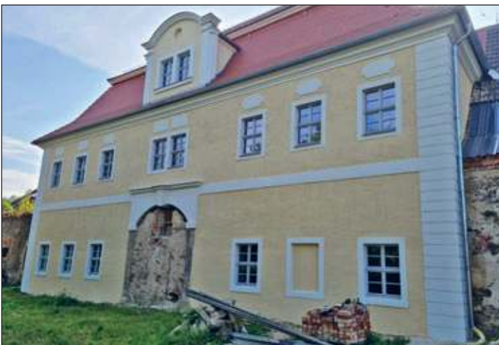
Fertiggestellte Fassade hinteres Torhaus

Das Rosengarten-Cafe ist sonntags von 14-17 Uhr für Sie geöffnet.