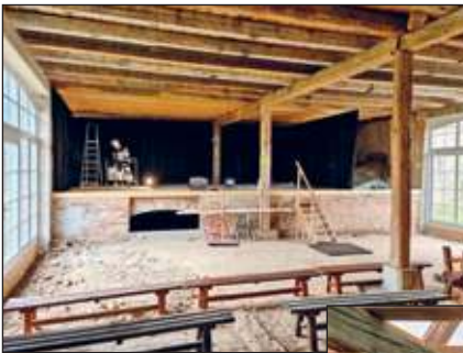
Bühnenbau in der Scheune