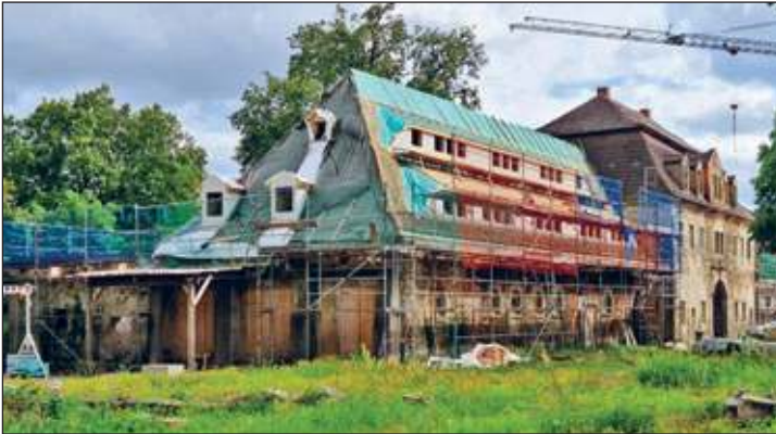
Dacheindeckung ehemaliger Pferdestall

Im Monat Juli wechselte der Kran zum nächsten Bauabschnitt, das hintere Torhaus wurde abgerüstet und dafür das nächste Stallgebäude eingerüstet. Am ehemaligen Pferdestall begannen die Dachdeckerarbeiten und die Scheune wird für die kulturellen Veranstaltungen vorbereitet.