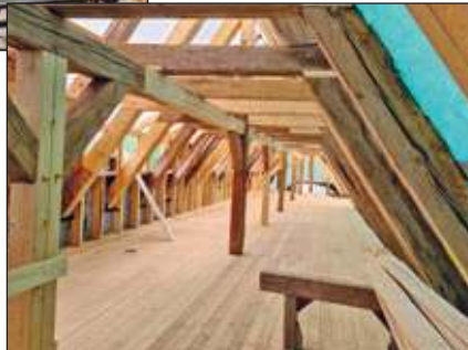
Blick in den Dachstuhl über dem Pferdestall