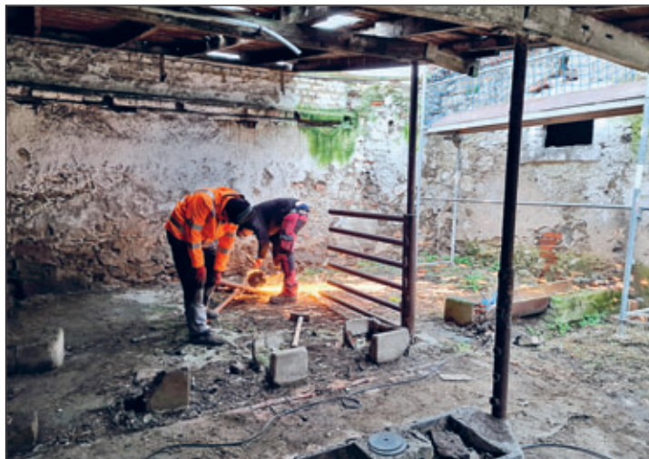
Firma Bothur – Rückbau im Schweinestall

Premium Resort Schloss Tiefenau Besitz GmbH