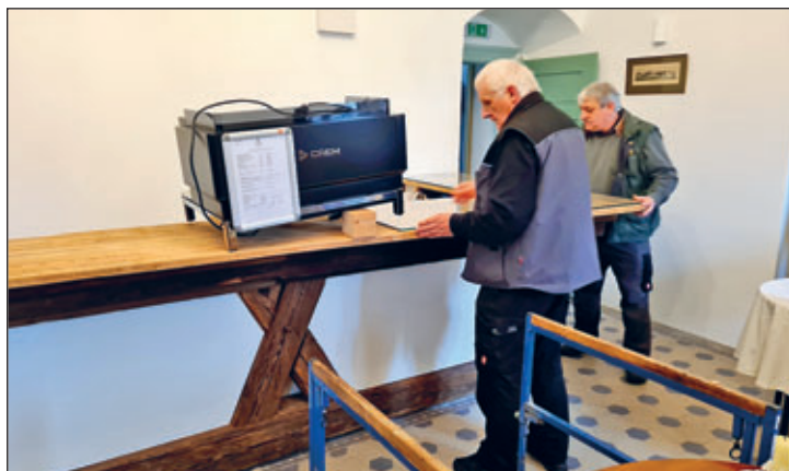
Firma Rastig – Verlegung der Glasplatten