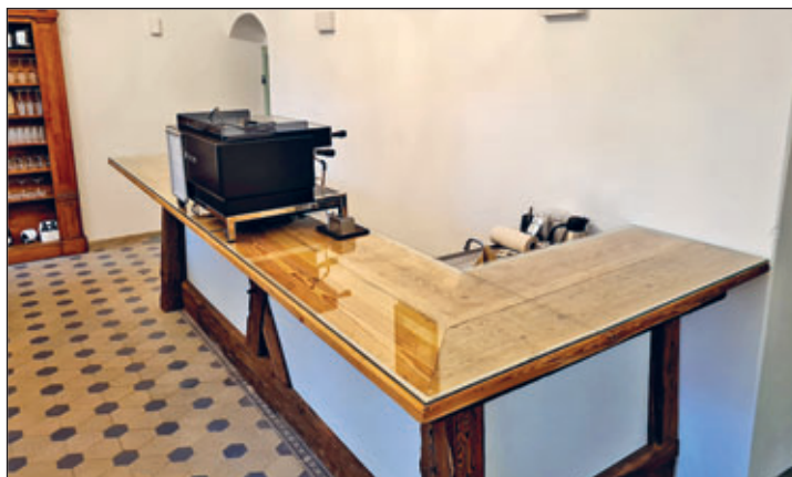
Tresen Schlosscafe mit neuer Glasabdeckung