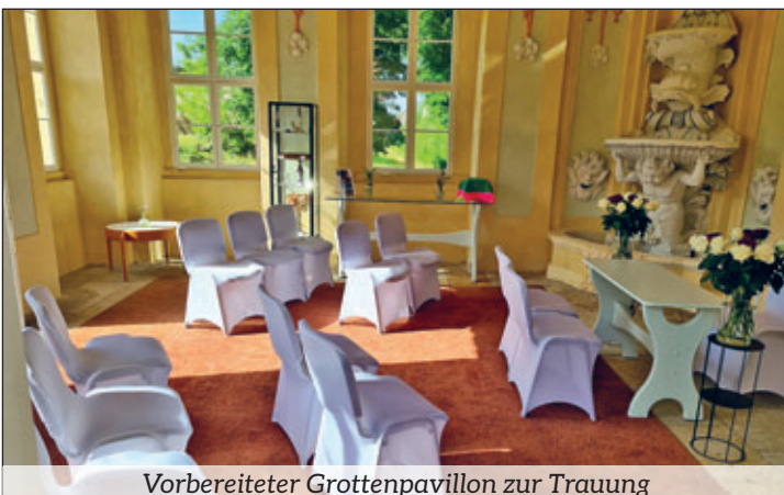
Vorbereiteter Grottenpavillon zur Trauung