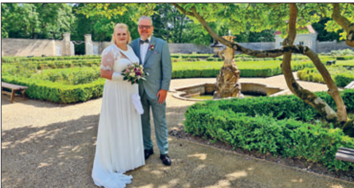
1. Hochzeitspaar in 2026