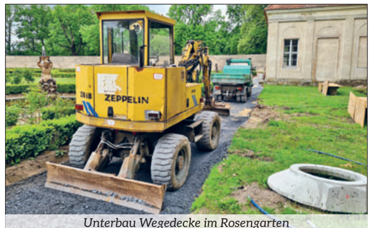
Unterbau Wegedecke im Rosengarten