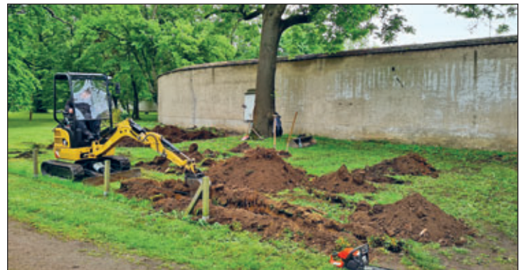
Aushub Fundamente und Kabelkanal für Fahrradstellplatz