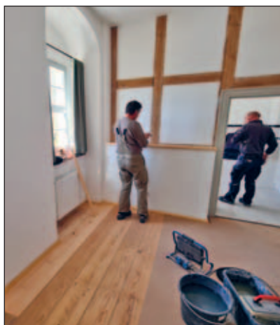
Letzte Arbeiten an den Suiten