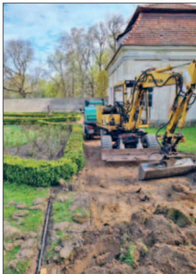
Beginn der Baggerarbeiten – Wegebau Rosengarten

Im Monat April wurde konzentriert an der Fertigstellung der ersten beiden Suiten im OG des vorderen Torhauses gearbeitet. Neben den eigenen Personal waren hier vor allem die Mitarbeiter der Fa. Wendt und der Fa. Elektro Gambke am Werk. So gelang die Arbeiten bis zur Veranstaltung zum Königstag weitestgehend zu beenden und die Suiten konnten den Besuchern präsentiert werden. Auch im Rosengarten starteten die Arbeiten für das Projekt zur Herstellung der sächsischen Wegedecke im westlichen Bereich durch die Firma Schulz. Außerdem wurden die Springbrunnen wieder aktiviert und die Arbeiten in den Rosenrabatten fortgeführt. Neben der schon erwähnten Veranstaltung zum niederländischen Königstag beteiligten wir uns im April ebenfalls am regionalem Entdeckertag. Ab dem Monat Mai ist nun jeden Sonntagnachmittag wieder unser Rosengarten – Cafe geöffnet.