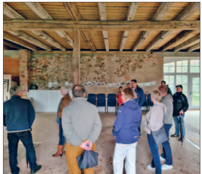
Führung zum Entdeckertag