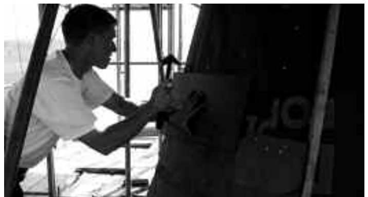
Spezialisten aus dem Erzgebirge: Firma Singer aus Zwönitz bei der Schiefereindeckung der Kirchturmspitze.

Fertiggestellt sind außerdem alle Sandsteinarbeiten am Turm sowie der Ringanker am Kirchenschiff. Begonnen wird gegenwärtig mit den Putzarbeiten am Turm.