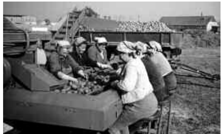
An der Kartoffelsortieranlage

Auch Rückschläge wie der Ausbruch der Maul- und Klauenseuche (1962), zwei große Dürreperioden und Hagelschlag (14.06.1971), bei dem ca. 3000 Masthähnchen getötet wurden, konnte die erfolgreiche Entwicklung nicht beeinträchtigen. Die bestehenden Strukturen der LPG genügten in den folgenden Jahren nicht mehr den Anforderungen an eine industriemäßige Produktion in der Landwirtschaft. So begannen sich ab 1969 die LPGen von Wülknitz, Streumen und Lichtensee (einschl. Tiefenau) zu einer Kooperationsgenossenschaft im Bereich Pflanzenproduktion zusammen zu schließen. Dadurch konnten größere Flächen gebildet und die Technik rationeller eingesetzt werden. Auf dieser Basis konnten auch größere Investitionen getätigt werden.