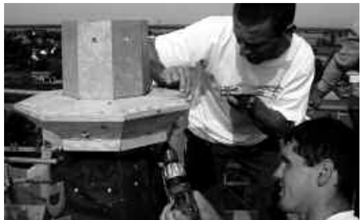
In luftiger Höhe: Zimmerleute der Fa. Nitsche aus Frauenhain bei der Montage des Turmkranzes.