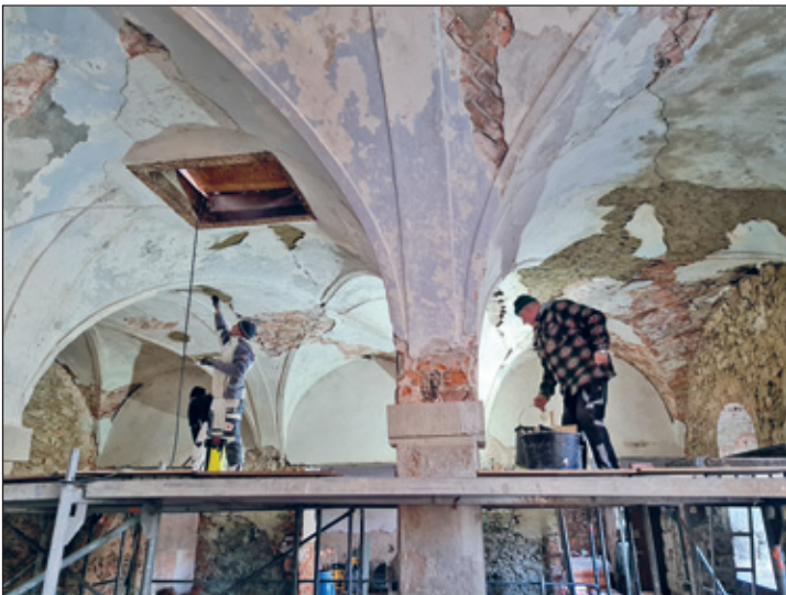
Deckenputz am Kreuzgewölbe im Haus 1