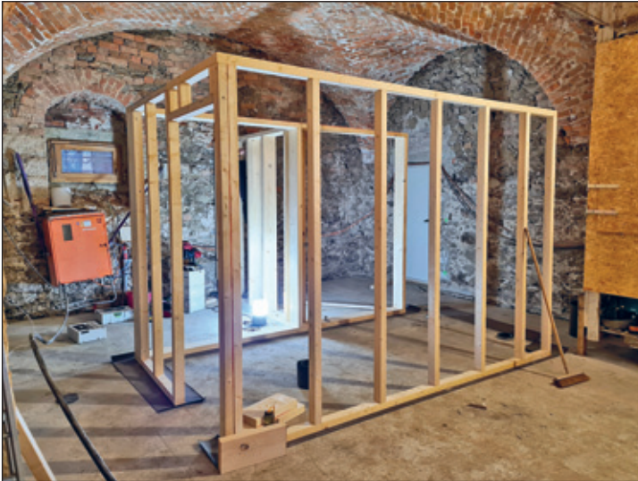
Beginn Trockenbau WC-Anlage

Premium Resort Schloss Tiefenau Besitz GmbH