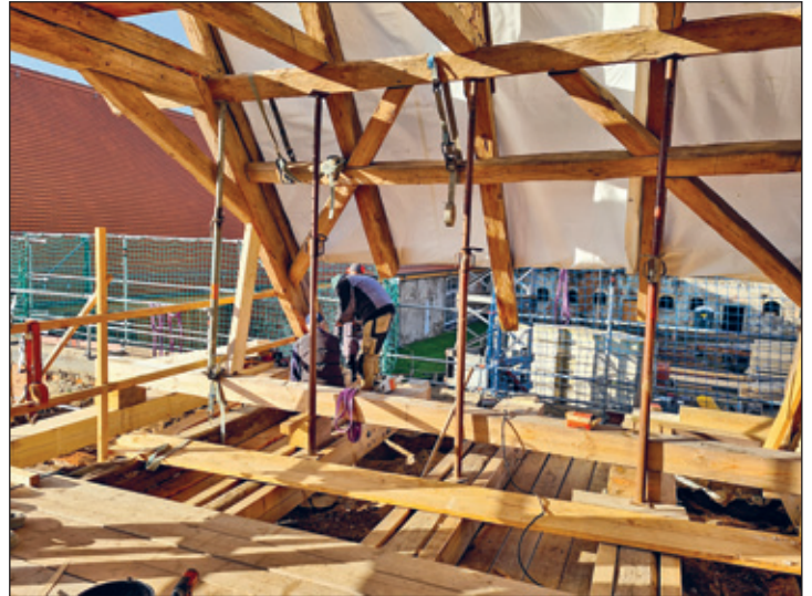
Dachstuhlarbeiten Haus 3