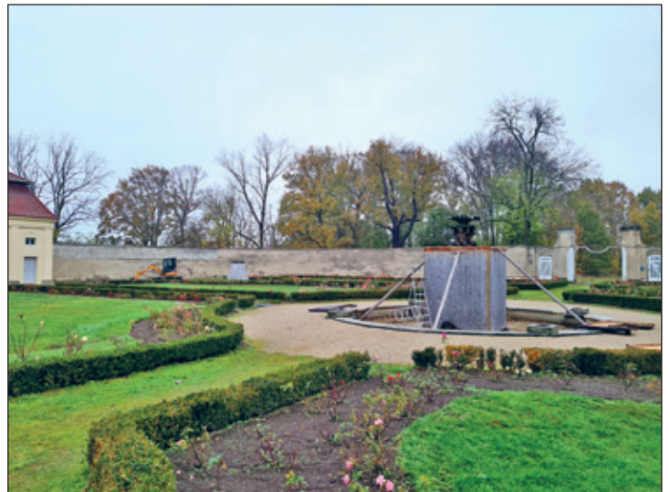
Einhausung Brunnen im Rosengarten