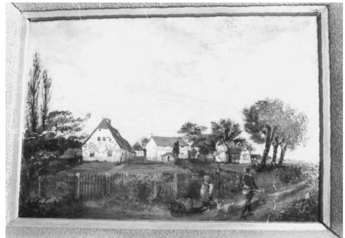
Ansicht von Heidehäuser um 1870 – Im Vordergrund Buschweg Nr. 2