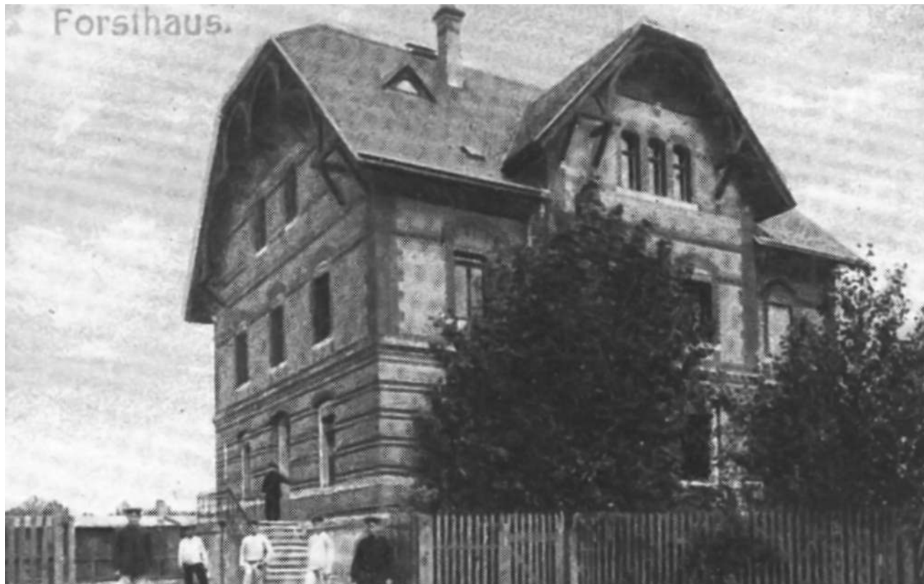
Alte Postkartenmotive: Ehemaliges Forsthaus Heidehäuser, heute Wohnpflegeheim