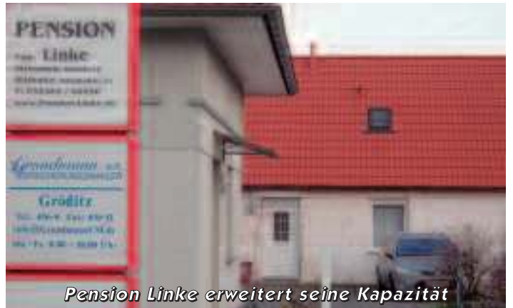
Pension Linke erweitert seine Kapazität