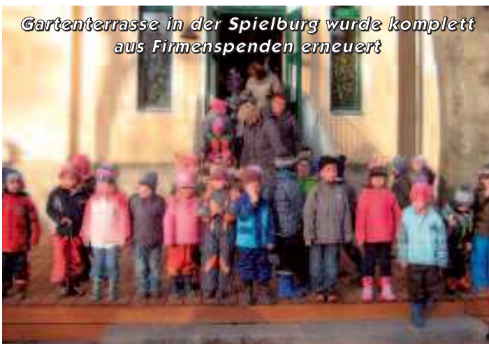
Gartenterrasse in der Spielburg wurde komplett aus Firmenspenden erneuert