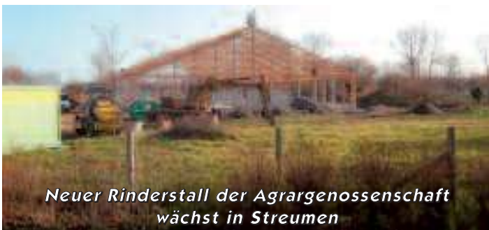
Neuer Rinderstall der Agrargenossenschaft wächst in Streumen