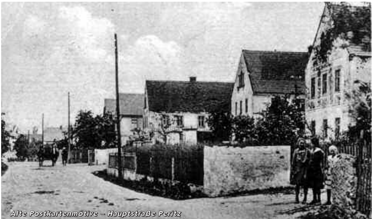
Alte Postkartenmotive – Hauptstraße Peritz