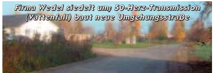
Firma Wedel siedelt um; 50-Hertz-Transmission (Vattenfall) baut neue Umgehungsstraße