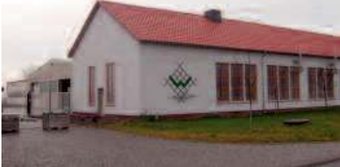
Zaunsysteme Wessel bereitet ehemaliges KFL-SSW-Grundstück auf Produktion vor