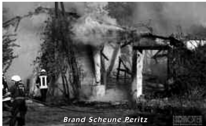
Brand Scheune Peritz

Herausragende Einsätze waren die beiden Großbrände am 29.06.2011 in Spansberg und am 02.10.2011 in Peritz.