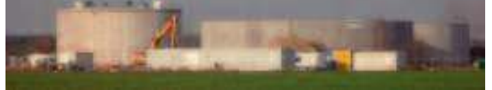
Danpower baut Biogasanlage in Lichtensee