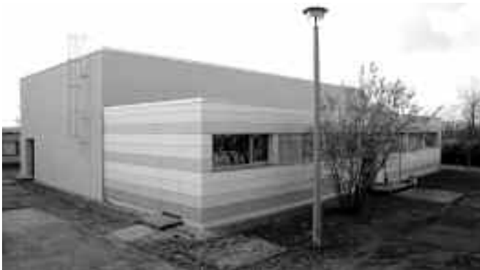
Sanierung Turnhalle ist abgeschlossen.