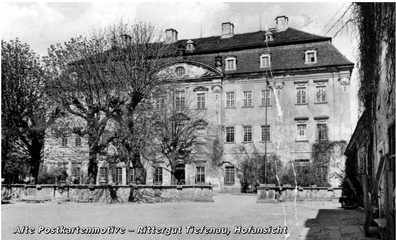
Alte Postkartenmotive – Rittergut Tiefenau, Hofansicht