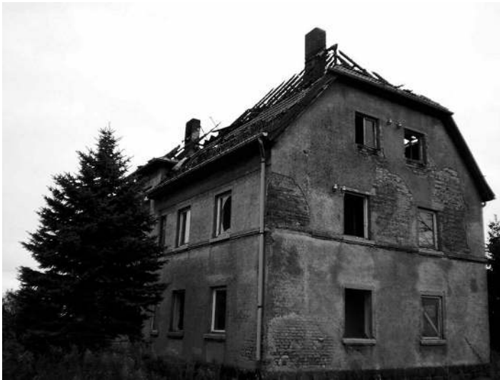
Abgeräumte Grundstücke und herunterhängende Energiekabel zu beseitigen. Überörtlich wurde die OFW Wülknitz nach Frauenhain und Gröditz alarmiert.