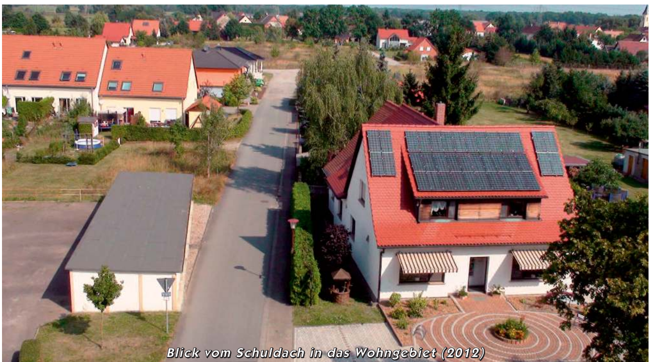
Blick vom Schuldach in das Wohngebiet (2012)