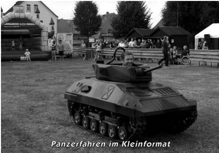
Panzerfahren im Kleinformat