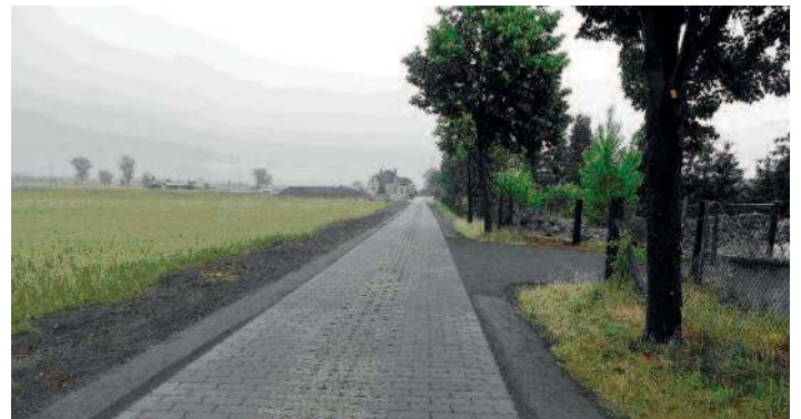
Lauchweg in Lichtensee.

Die Wegebaumaßnahmen der Teilnehmergemeinschaft dienen vordergründig der Erschließung der land- und forstwirtschaftlichen Flächen und sollen zur Entflechtung des landwirtschaftlichen Verkehrs und somit auch zu einer besseren Durchgängigkeit des öffentlichen Straßennetzes führen. Aber auch für die Freizeitnutzung zu Fuß oder mit Rad sind diese Wege attraktiv und dieser Gebrauch auch erwünscht. Mit weiteren Maßnahmen wie der Anlage von Pflanzungen entlang von Wegen und Gewässern oder zur Gliederung der Flur wird das Landschaftsbild gestaltet und der Naturhaushalt gestärkt.