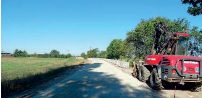
Panzerstraße zwischen Wülknitz und Bahn im Bau.

Mit welchen Maßnahmen das Flurbereinigungsgebiet entwickelt wird, beschließt der Vorstand der Teilnehmergeinschaft, jedoch können sich alle Teilnehmer mit Ihren Ideen und Vorschlägen einbringen. Die Herstellungskosten der gemeinschaftlichen Anlagen werden von Bund und Land mit 85 % gefördert. Die verbleibenden 15 % (Eigenanteil) haben die Teilnehmer durch Beiträge zu erbringen. Um auch den Ausbau in den folgenden Jahren abzusichern, wird seit August die zweite und letzte Beitragsrate erhoben. Der Eigenleistungsanteil konnte durch Zusatzverpflichtungen der Gemeinde Wülknitz auf 150 €/ha begrenzt werden.