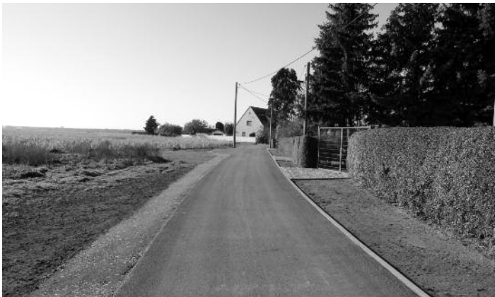
Heidehäuser Buschweg Teil 1.