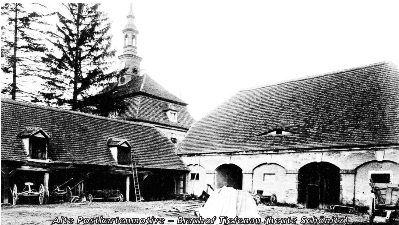
Alte Postkartenmotive – Brauhaus Tiefenau (heute Schönitz)