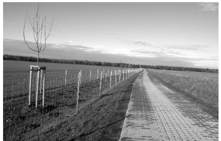
Pflanzung am Mühlberger Weg.

Für alle Maßnahme wird die Schlussabrechnung bis zum Jahresende durchgeführt.