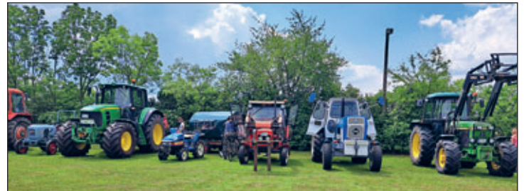
Traktoren- und Oldtimertreff

zu spät geworden ist. Fußball stand an. Die Mannschaften aus Colmnitz, Koselitz, Streumen und Peritz waren angetreten, den Sieger zu ermitteln. Am Ende konnte sich Koselitz vor Streumen durchsetzen. Nun ging es daran den Vogel mit der Armbrust zu attackieren. Kaffee und Kuchen wechselten wieder den Besitzer. Für den Auftritt des „Super Dance Club e.V. Gröditz“ musste das Vogelschießen unterbrochen werden. Danach wurde fleißig weiter auf das Federvieh geschossen. Und kurze Zeit später dachten wir den Sieger ermittelt zu haben. Das Problem, es hing noch ein kleines Holzstück oben. Das Schiedsgericht trat zusammen und entschied den Wettbewerb fortzusetzen. So nahm das Schicksal seinen Lauf. 14 Jahre habe ich gebraucht, nun gewann ich das Vogelschießen 2024. Auch in diesem Jahr haben wir ein wunderschönes Dorffest gefeiert, wurden mit Getränken von der PAT UG zuverlässig versorgt. Um das Essen hat sich das Team der „Drei Lilien Glaubitz“ hervorragend gekümmert. Ich möchte mich an dieser Stelle bei allen Helfern, Organisatoren, dem Bauhof und natürlich bei unseren Sponsoren auf das Herzlichste bedanken. Holger Dörschel