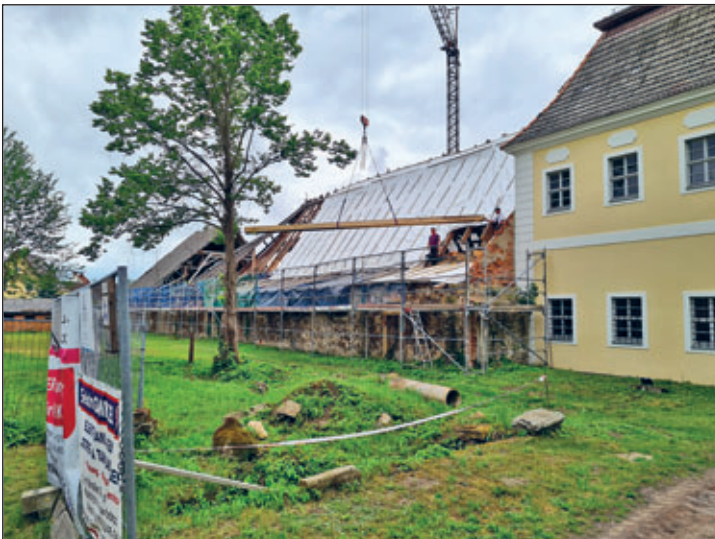
Einbau Deckenbalken Haus 3

stuhl von Haus 3. Hier werden die ersten Deckenbalken erneuert. Ende Mai begann die Firma Wolf in Unterstützung mit der Firma Hubrig den Erdaushub für das künftige Küchenfundament. Kulturrell war das Schlosspils-Traktat-Fest am Pfingstsonntag der Höhepunkt im Mai. Hierfür ein großer Dank an die Görziger – ihr ward Klasse! Viele Grüße