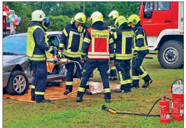
Vorführung der Feuerwehr Streumen