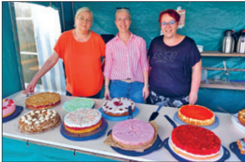
Kaffee und Kuchen serviert durch die Peritzer

Angekündigt waren Unwetter, Starkregen und Gewitter. Das alles hielt uns nicht davon ab, unser Dorffest am 1. und 2. Juni zu feiern. Rückblickend können wir feststellen: das Wetter am Feierwochenende war nahezu perfekt. Mit dem 13. Peritzer Traktoren- und Oldtimertreffen startete auch in diesem Jahr unser Fest. Der erste Höhepunkt war die Ausfahrt der Traktoren und Oldtimer, es ging