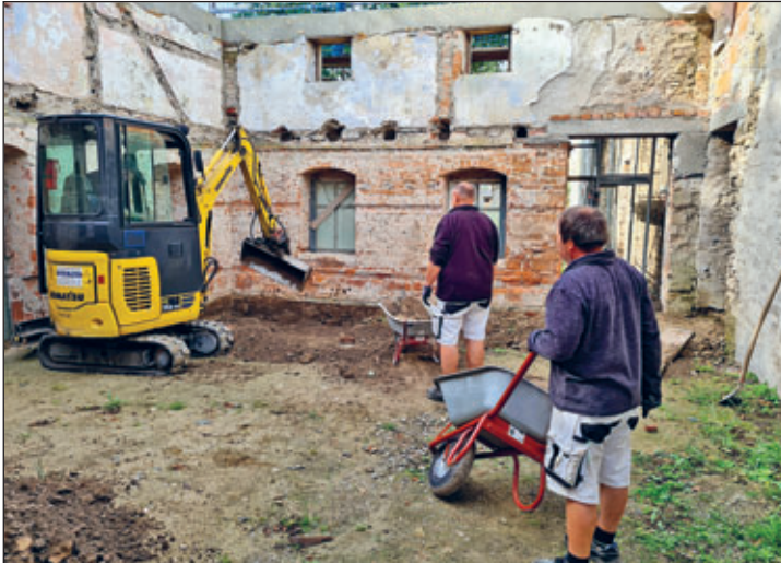
Aushub Fundament Küche

Der Mai ist gekommen und brachte wie immer einen hohen Pflegeaufwand im Rosengarten und Parkgelände mit sich. Alles wächst und gedeiht, leider auch das Unkraut in den Rabatten. Hier mal ein Lob an unsere Gärtner – der Rosengarten ist in einem sehr guten und ansehnlichen Zustand! Aber auch das Baugeschehen nimmt nun wieder Fahrt auf. Firma Voigtländer baut momentan am Dach-