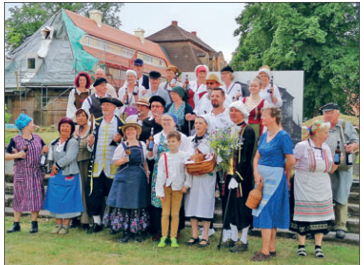
Gruppenbild mit den Görziger Bauern zum Schlosspils-Traktat-Fest