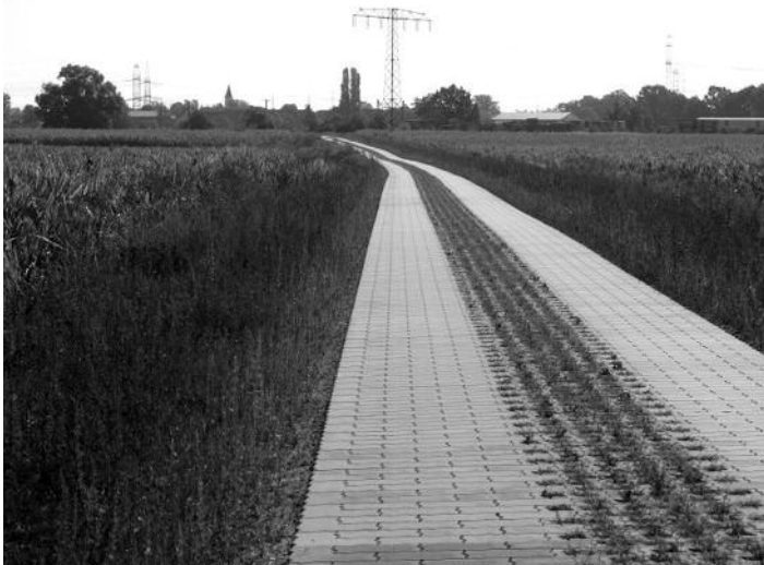
Panzerstraße Teil 1

maßnahme wird es zu verkehrstechnischen Einschränkungen im Einwirkungsbereich kommen, die mit den Anliegern im Vorfeld noch abgestimmt werden. Weitere Wegebaumaßnahmen in diesem Jahr sind durch die Teilnehmergeinschaft Lichtensee dann nicht mehr geplant.