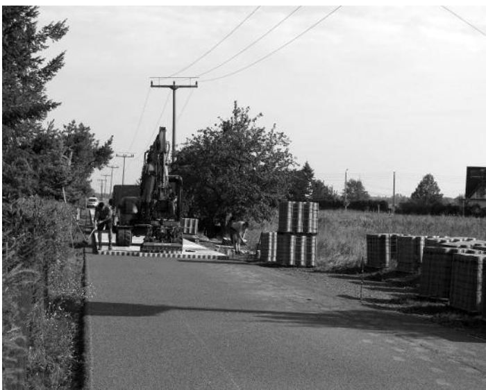
Bettelweg Teil 1

Mit der Ausführung der genannten Maßnahmen entstehen der Teilnehmergeinschaft 2019 Ausgaben in Höhe von ca. 490 T€ Diese werden zu 85 % durch Bund und Freistaat bezuschusst. Der verbleibende Anteil von ca. 73 T€ wird von der Teilnehmergeinschaft Lichtensee durch einen Teil der vor kurzen erhobenen Beiträge (ca. 44 T€) und der Gemeinde Wülknitz (ca. 29 T€) aufgebracht. An dieser Stelle möch-