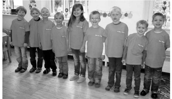
Schulanfänger der Kita Streumen.

Elternaktiv-Vorsitzender der Spielburg Streumen