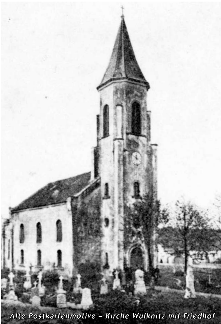
Alte Postkartenmotive – Kirche Wülknitz mit Friedhof

die Zeit des Herbstes ist auch durch eine Kultur des Trauerns geprägt. Seit langer Zeit ist der Sonntag vor dem 1. Advent der Totensonntag, an dem in besonderer Weise an die verstorbenen Familienangehörigen und Freunde gedacht wird. Nicht ganz so alt ist der Volkstrauertag in Deutschland, an dem es um die Kriegstoten und die Opfer der Gewaltherrschaft geht. In Deutschland hat sich im Laufe der Jahrhunderte eine Bestattungskultur entwickelt, die bis vor wenigen Jahren in unseren kleinen Dörfern noch sehr lebendig war. Durch Begegnungen mit anderen Traditionen in der Welt, durch erhöhte Mobilität, vor allem aber durch eine Veränderung der familiären Strukturen