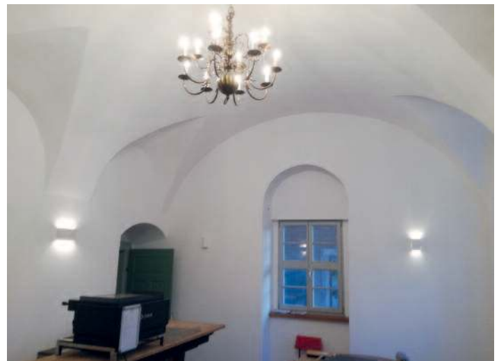
Schlosscafé nach der Installation der Beleuchtung.

Fertiggestellt werden konnte ebenfalls schon unser künftiges Schlosscafé incl. Nebenraum im Torbogenhaus. Diese Räume wurden auch schon bei einer Eventwoche mit der Sparkasse Meißen Ende November gut genutzt.