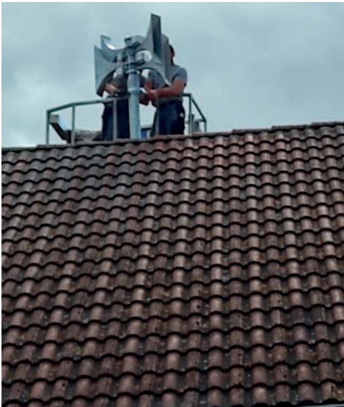
Die neue Sirene wird montiert.