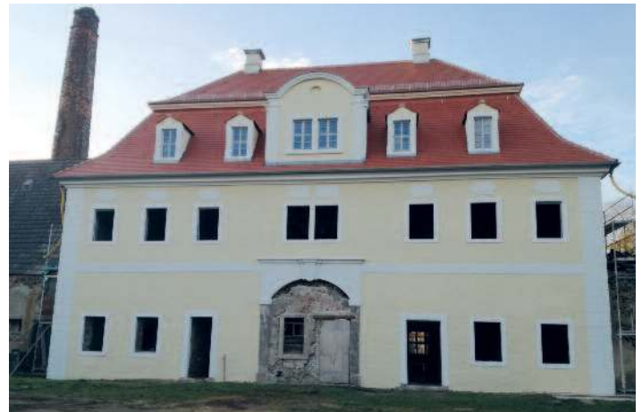
Fassade des hinteren Torhauses vor dem Fenstereinbau.

wurden. Außerdem sind die Fenster sowie die beiden Türen eingebaut. So erstrahlt dieser Gebäudeteil fast schon im alten Glanz.