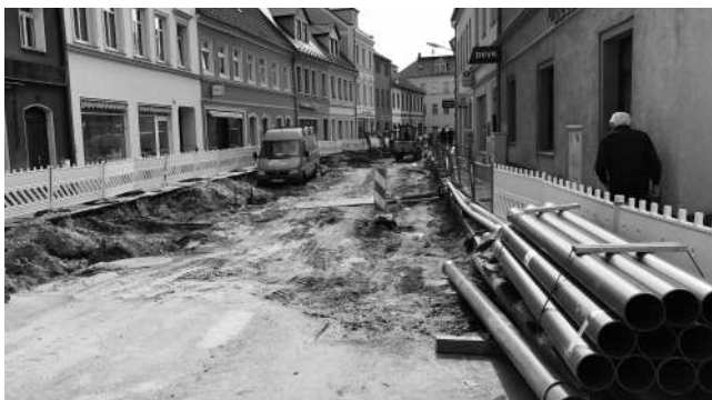
In der Berliner Straße werden alte Rohre ersetzt.

Im Zuge der Baumaßnahmen der Deutschen Bahn an der Bahnstrecke Dresden-Berlin wurden im I. Quartal 2017 eine Bahnkreuzung im Bereich der Großraschützer Straße neu gebaut und die Bahnkreuzung in der Parkstraße umverlegt.