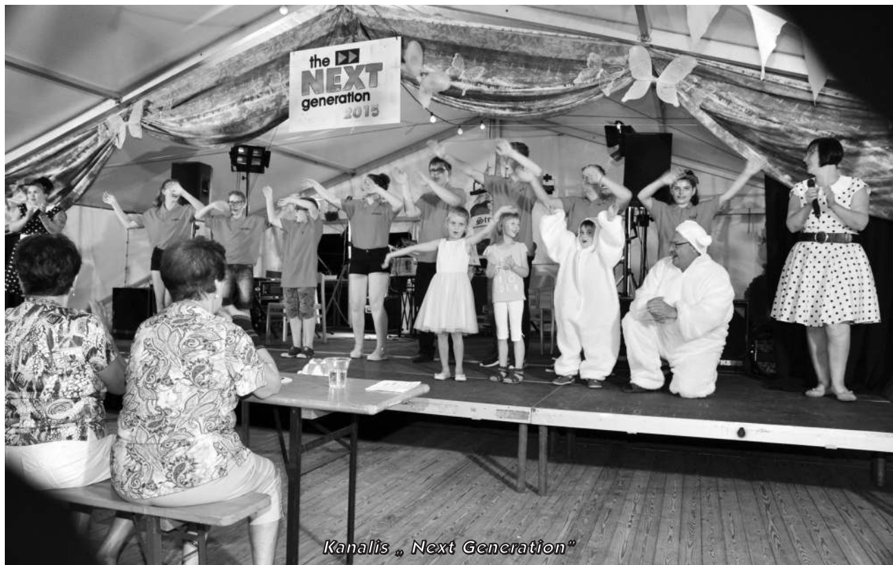
Kanalis „Next Generation“