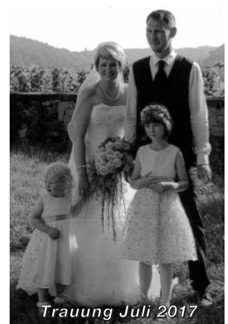
Trauung Juli 2017