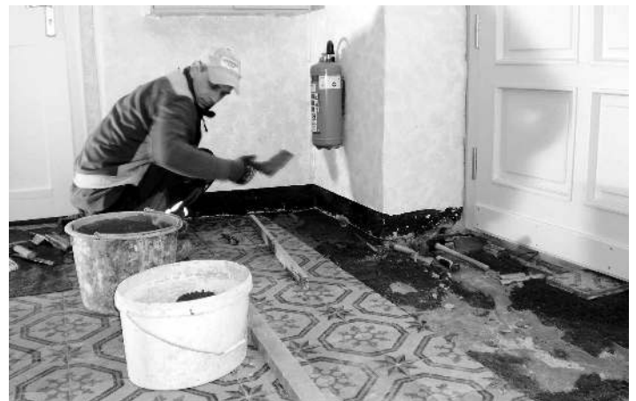
Ein Mitarbeiter der Firma Boberach beim Verlegen der alten Bodenfliesen im Flur des Pfarrhauses.

Das Kirchenspiel Zeithain stellt der Gemeinde Wülknitz seit 2013 die Räume im Pfarrhaus Streumen zur gemeinschaftlichen Nutzung mit der Kirchengemeinde zur Verfügung. Über das Programm des Freistaates Sachsen „Barrierefreies Bauen“ wurde eine behindertengerechte Toilette eingebaut, 4 Innen- und die Haustür erneuert, Stufen beseitigt und das Pflaster im Außenbereich angehoben. (Kosten ca. 27 TEuro, davon 25 TEuro Förderung). Von den Mitarbeitern des Bauhofes wurde im Herbst das Nebengebäude neu verputzt. Im Pfarrgarten wurden im Winter durch Bauhofmitarbeiter alle Nadelgehölze gefällt und Brombeerbüsche gerodet. Der Garten ist als Streuobstwiese in der unteren Naturschutzbehörde gelistet, im Herbst sollen Obstbäume nachgepflanzt wurden.