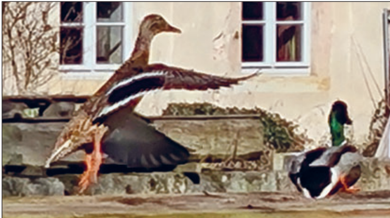
Gefiederte Besucher im Gutshof