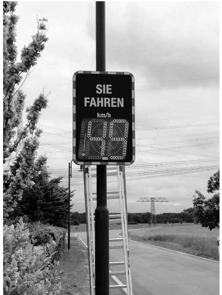
Gemeinsam mit der Gemeinde Röderau haben wir eine mobile elektronische Geschwindigkeitsanzeige angeschafft.

Falls der Gemeinderat diesmal eine Änderung beschließt, soll die Straße mit den meisten Anliegern (incl. Gewerbe) ihre bisherige Bezeichnung behalten (unterstrichen), die anderen brauchen dann einen neuen Namen.