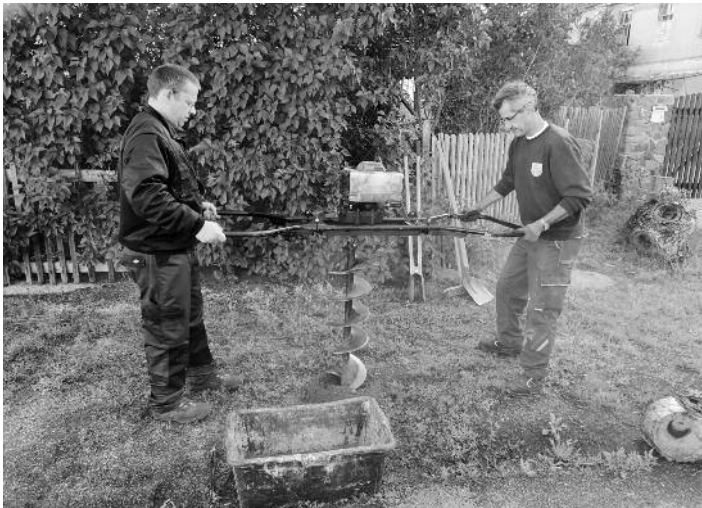
Lichtensee – Vorarbeiten für neue Verkehrszeichen in Nebenstraßen, Geschwindigkeitsbegrenzung auf 30