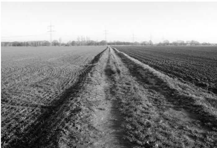
„Buschwiesenweg“ (vor dem Ausbau)

Für den „Weg am Brauteich“ (ab B 169 bis zur Fischergasse in Tiefenau) liegt die Bauplanung zur abschließenden Genehmigung bei der Fachaufsicht der Teilnehmergeinschaft. Neben der schonenden Aktivierung der Wegedeckschicht sollen auch die maroden, den Weg querenden Durchlässe (Teufelsgraben, Mühlgraben, Zufluss Brauteich) erneuert werden. Nach der Genehmigung können Fördermittel beantragt und der Ausschreibungsauftrag ausgelöst werden, so dass diese Maßnahme in diesem Jahr noch umgesetzt werden kann.