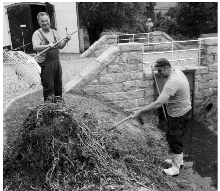
Peritz Dorfstraße – Rietzschke säubern