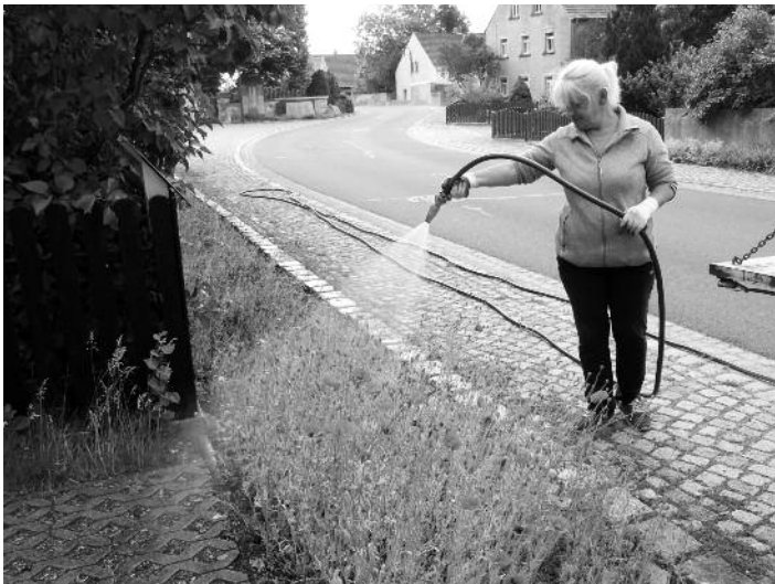
Wülknitz – Pflege der „Blühenden Grünflächen“; siehe auch unter Elbe-Röder-Dreieck (Seite 7).