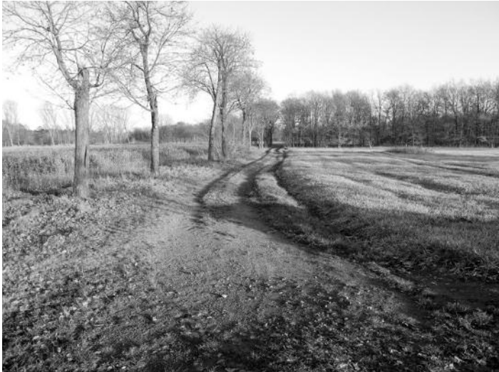
„Driftweg Teil 1“ (vor dem Ausbau)

wendigen Arbeiten am „Buschwiesenweg“ (am Bettelweg zwischen Wülknitz und Tiefenau gelegen), am „Scheibenweg“ und am „Driftweg Teil 1“ (beide am Spansberger Weg zwischen Tiefenau und Spansberg gelegen). Alle Wege sollen nach der Herstellung der notwendigen Tragfähigkeit als Schotterwege mit einer sandgeschlämmten Decke ausgebaut werden. Mit dem Ausbau der Wege ist die Firma STRABAG AG, NL Meißen beauftragt. Die dafür erforderlichen Fördermittel sind der Teilnehmergeinschaft bereits zugewiesen worden.