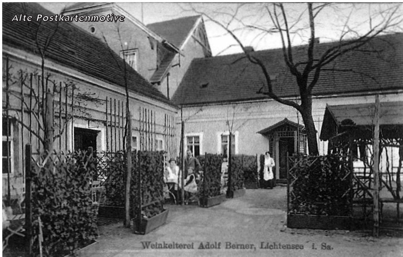
Weinkelterei Adolf Berner, Lichtensee i. Sa.