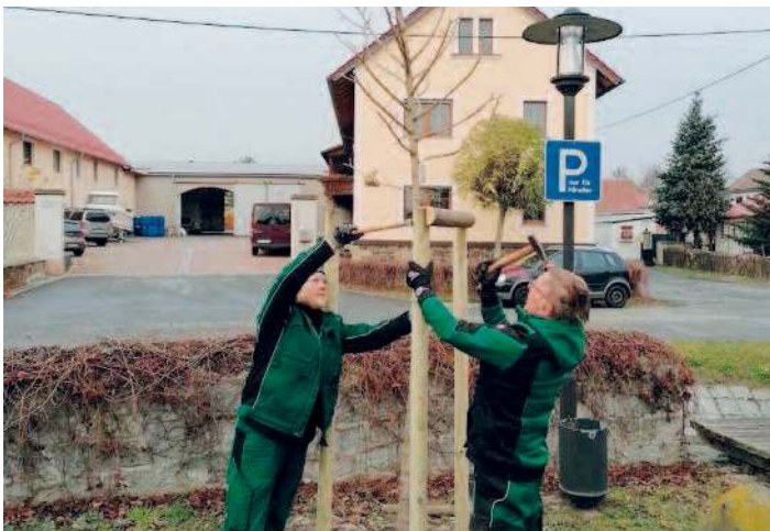
Ersatzpflanzung von Baumhasel durch die Fa. Baumschule Franke aus Glaubitz.