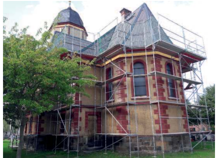
Dachsanierung Kirche durch Kirchgemeinde Zeithain.