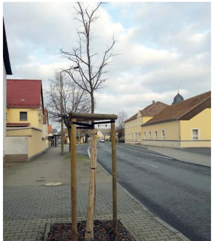
Neupflanzung von Straßenlinden.