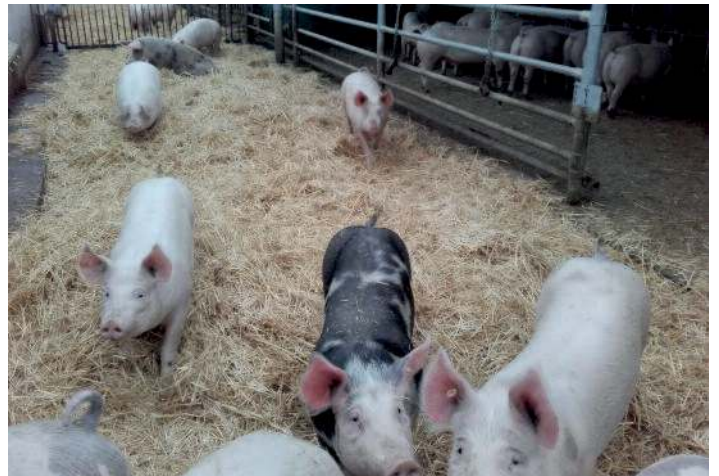
Umbau der Schweineanlage Buschgasse zur ökologischen Haltung mit Freianlage durch Agrargenossenschaft.