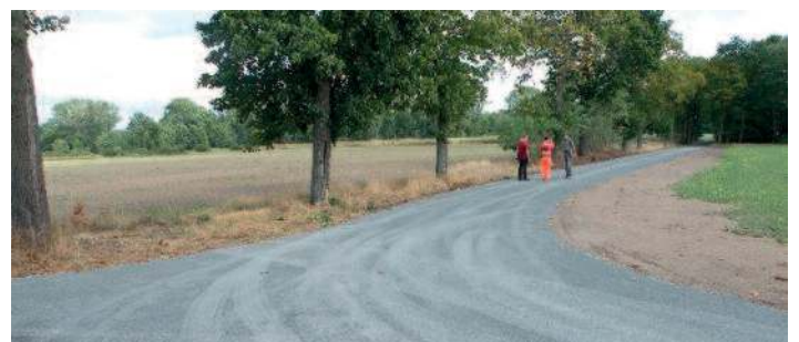
Erneuerung Driftweg Teil 1, auch TG.