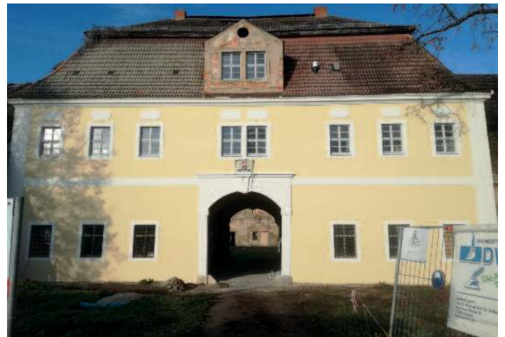
Rittergut – Fassade Torhaus erneuert durch Premium Resort Schloss Tiefenau Besitz GmbH.