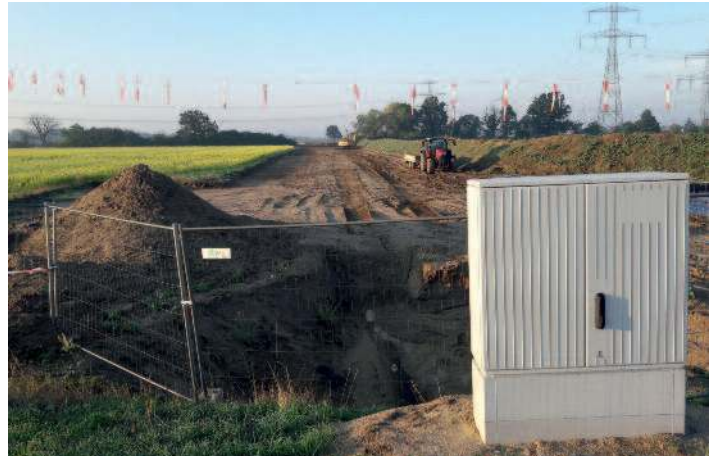
Erneuerung Gasleitung durch ONTRAS Gastransport GmbH Leipzig.