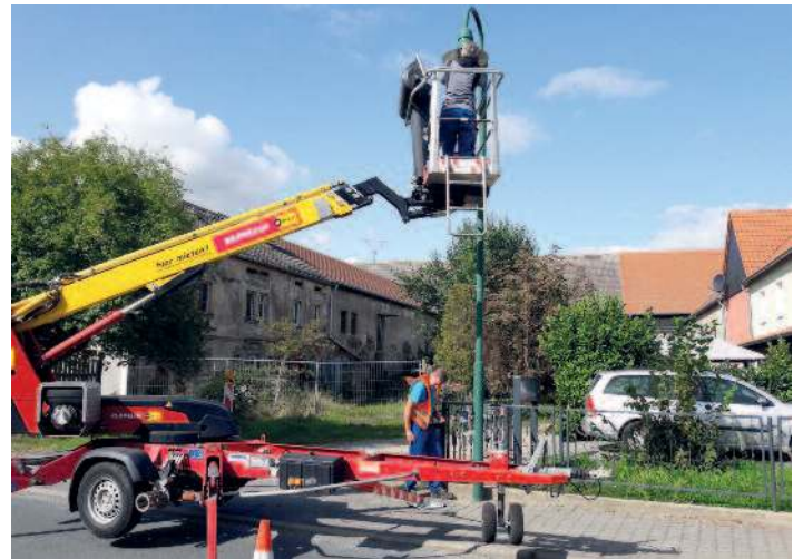
Instandsetzung Straßenbeleuchtung (laufend).