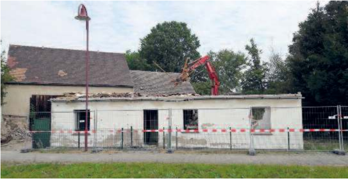
Abbruch, Vorbereitung für Feuerwehrgerätehaus Tiefenau.