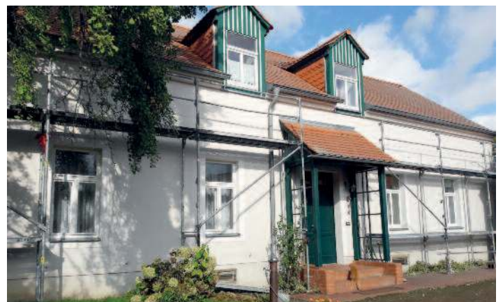
Erneuerung Hoffassade Gemeindehaus.