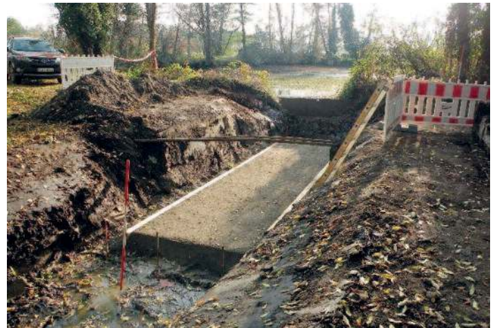
Erneuerung Weg Brauteich – Fischergasse durch die Teilnehnergemeinschaft (TG) Flurbereinigung Lichtensee.