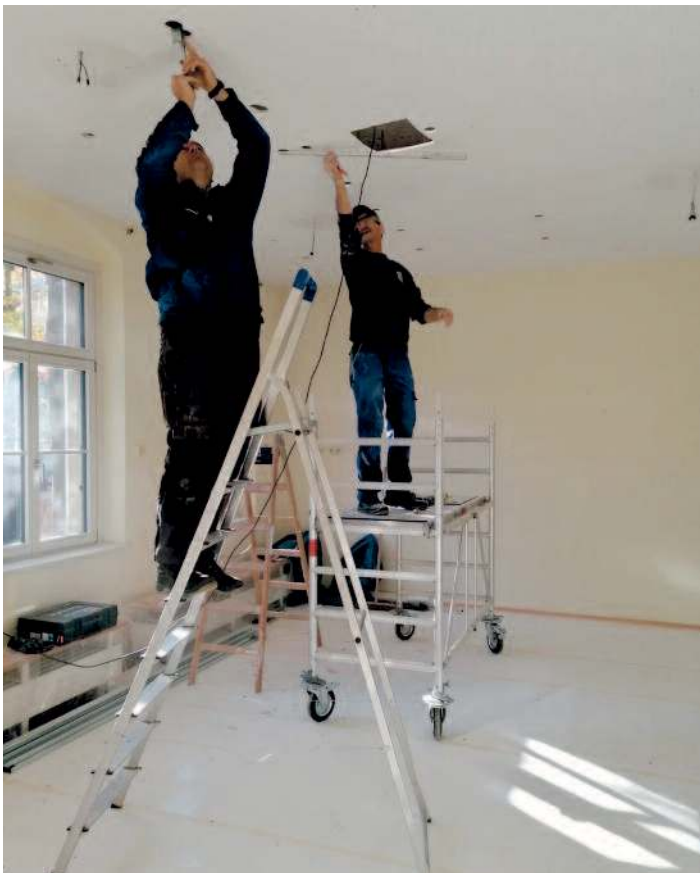
Instandsetzungsmaßnahmen u.a. Einbau Akustikdecke im EG.