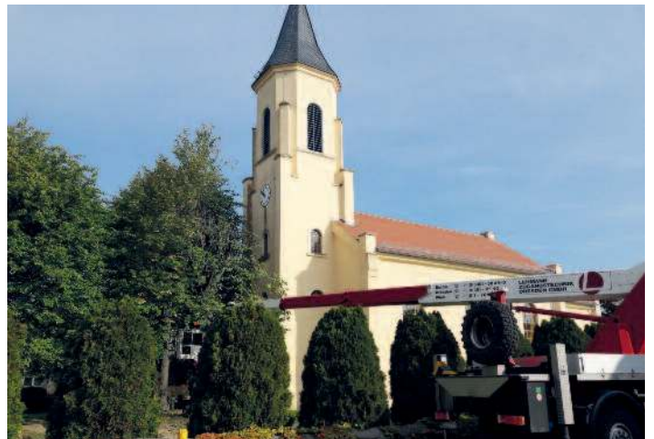
Baumschnittmaßnahmen u. a. Friedhof Wülknitz.