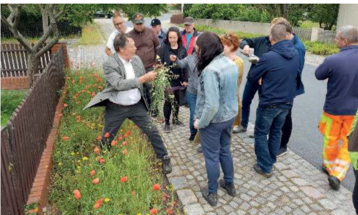
Pflege „Blühende Grünflächen“ – Projekt des Elbe-Röder-Dreieck.