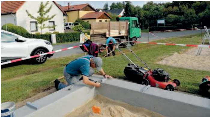
Erweiterung und Sanierung Spielplatz.