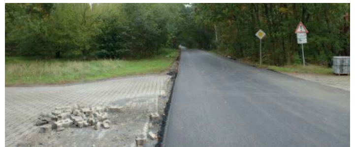
Sanierung Kreisstraße Ortseingang Peritz – Peritzberg durch Landkreis Meißen.