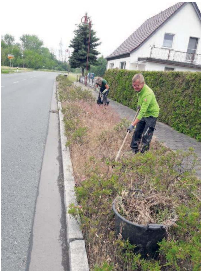
Pflanzung und Pflege der Rabatten entlang der B 169 und am Parkplatz.