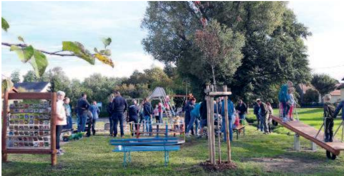
Einweihung am 04.10.2020.