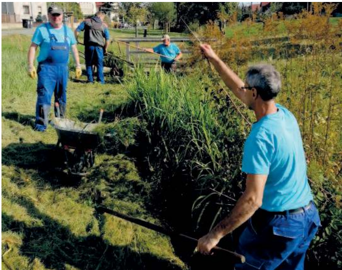
Gewässerpflege durch Bauhof.