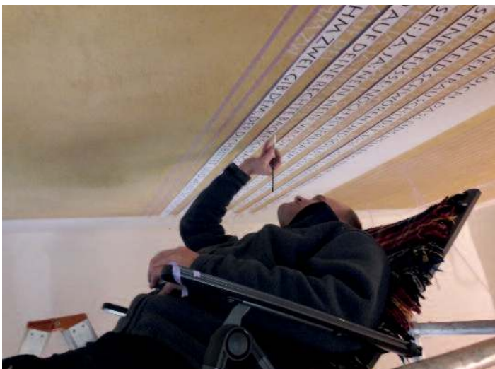
Innensanierung der Kirche durch Kirchgemeinde Zeithein.