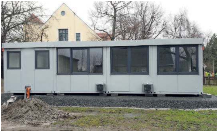
Aufstellung mobile Raumeinheit in Kita.