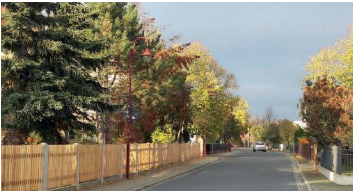
Sanierung Gartenstraße/Bahnhofstraße durch Landkreis.