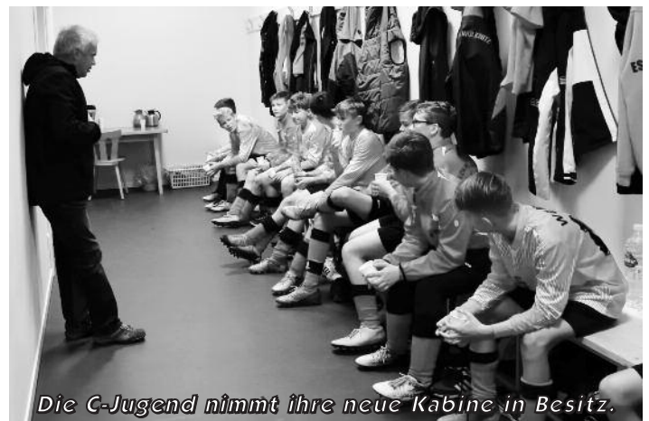
Die C-Jugend nimmt ihre neue Kabine in Besitz.

Auch wenn der Neubau in diesem Jahr das dominierende Ereignis für den ESV war, der reguläre Sportbetrieb fand natürlich auch wie gewohnt statt. Mit den großen sportlichen Erfolgen wird das Jahr 2018 später nicht in der Chronik des Vereins zu finden sein. Umso mehr aber als ein Jahr, in dem das Sportangebot des Vereins deutlich erhöht werden konnte. Nach dem Beitritt der Gymnastikgruppe Wülknitz am An-