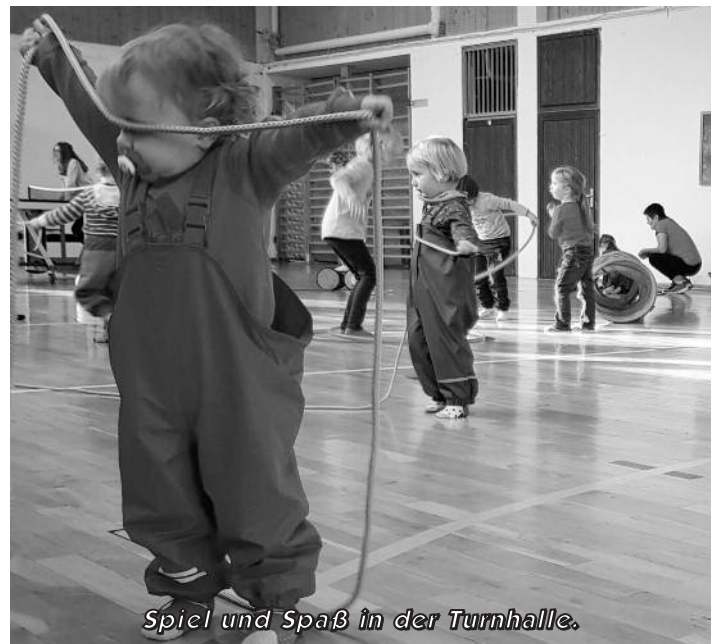
Spiel und Spaß in der Turnhalle.

Mit zwei großartigen Eröffnungstagen hat der ESV Lok Wülknitz am 2. und 3. Oktober sein neues Domizil in Besitz genommen. Nach der offiziellen Eröffnung mit vielen am Bau beteiligten Personen stand das Sportlerheim am 3. Oktober nun erstmals der Öffentlichkeit zur Verfügung.