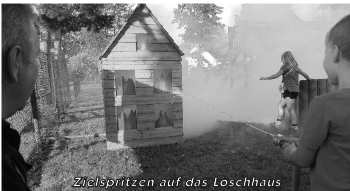
Zielspritzen auf das Loschhaus

Am Sonntag sorgten die Geißlitztaler Musikanten für einen musikalischen Frühschoppen. Die Betreuer der Kinderfeuerwehr luden zum Basteln und einem Hindernisparcours ein.