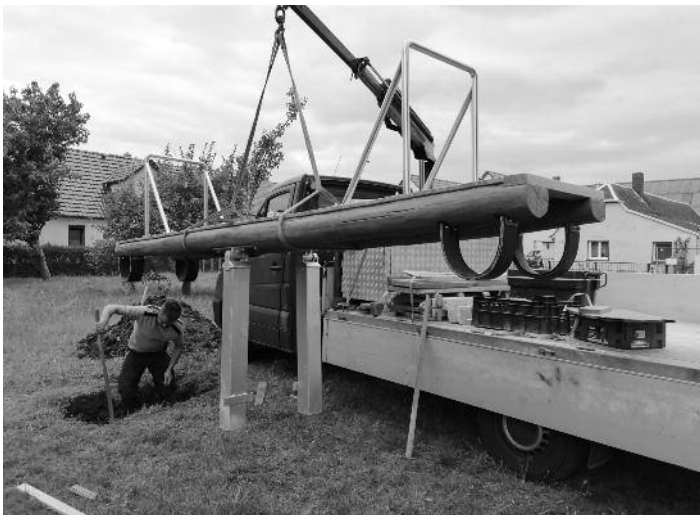
Montage der neuen Wippe auf dem Spielplatz in Peritz.