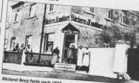
Biererei Beetz Peritz nach 1930