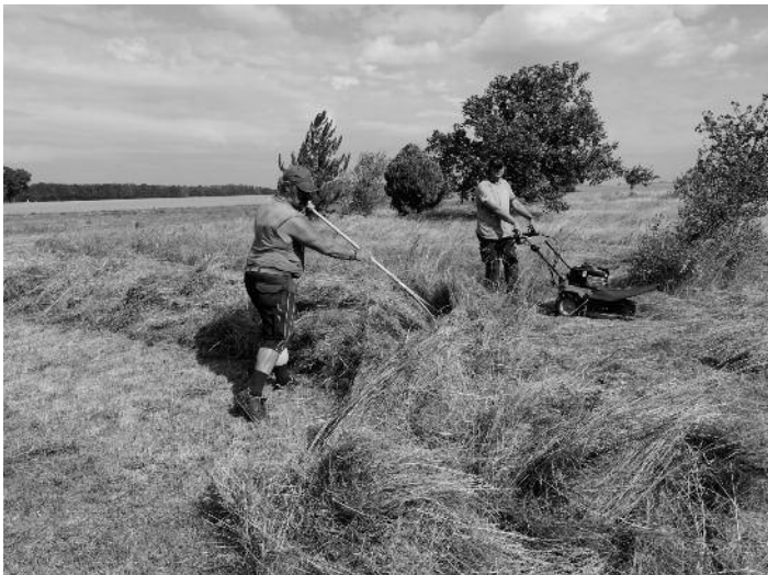
Mahdumstellung: Ausgewählte Flächen werden mit dem neuerworbenen Kreiselmäher 1-2 mal im Jahr geschnitten – hier Peritz ehemalige Kleingartenanlage Koselitzer Weg.