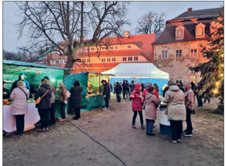
Schlossweihnacht im Rittergut