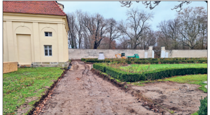
Wegebau im Rosengarten