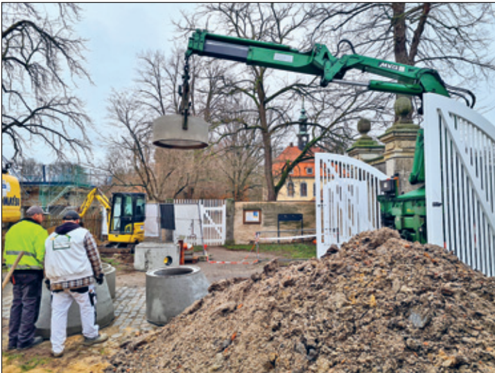
Tiefbauarbeiten durch Fa. Hubrich und Fa. Wolf