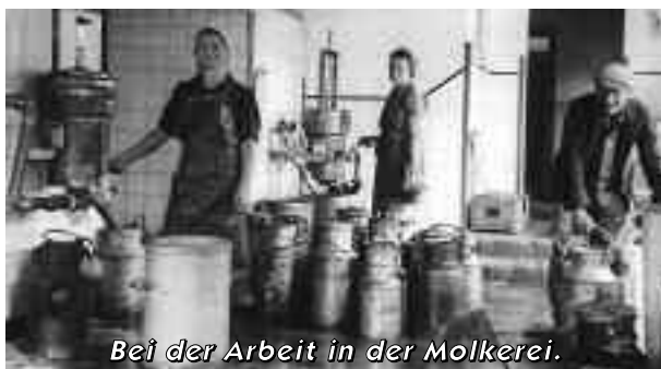
Bei der Arbeit in der Molkerei.