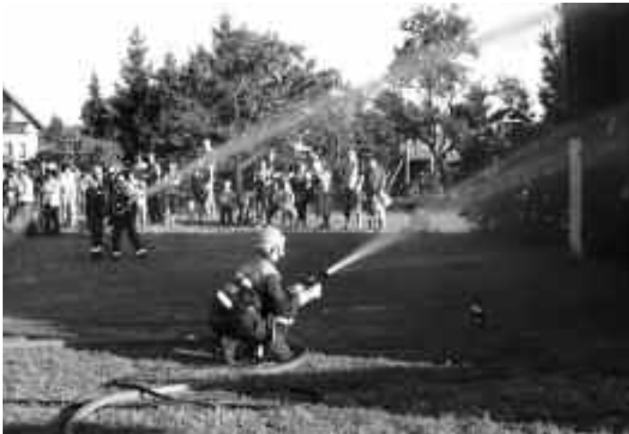
Zuschauer beobachten die Einsatzübung.