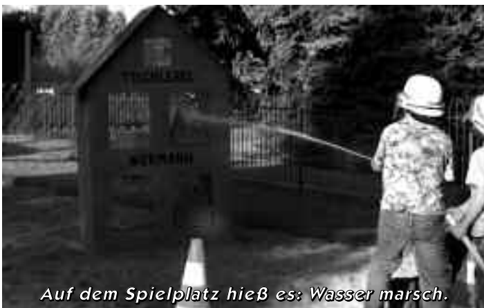
Auf dem Spielplatz hieß es: Wasser marsch.